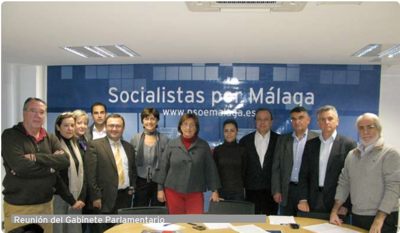
Reunión del Gabinete Parlamentario