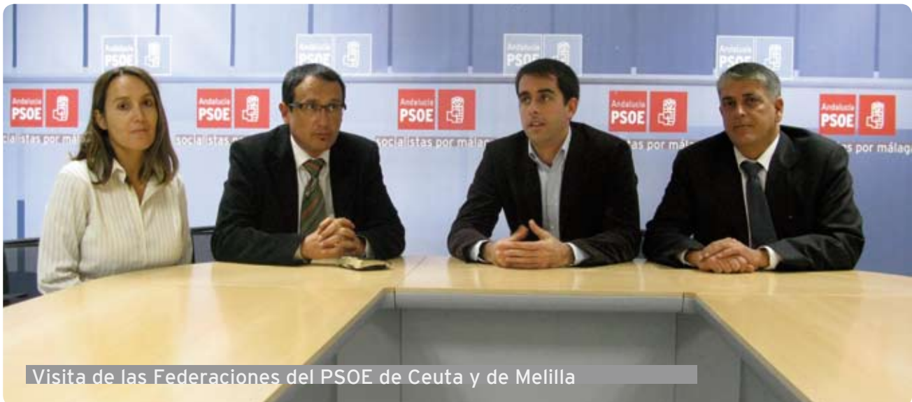
Visita de las Federaciones del PSOE de Ceuta y de Melilla