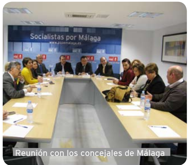
Reunión con los concejales de Málaga