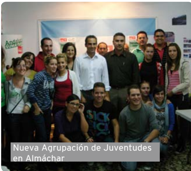
Nueva Agrupación de Juventudes en Almáchar