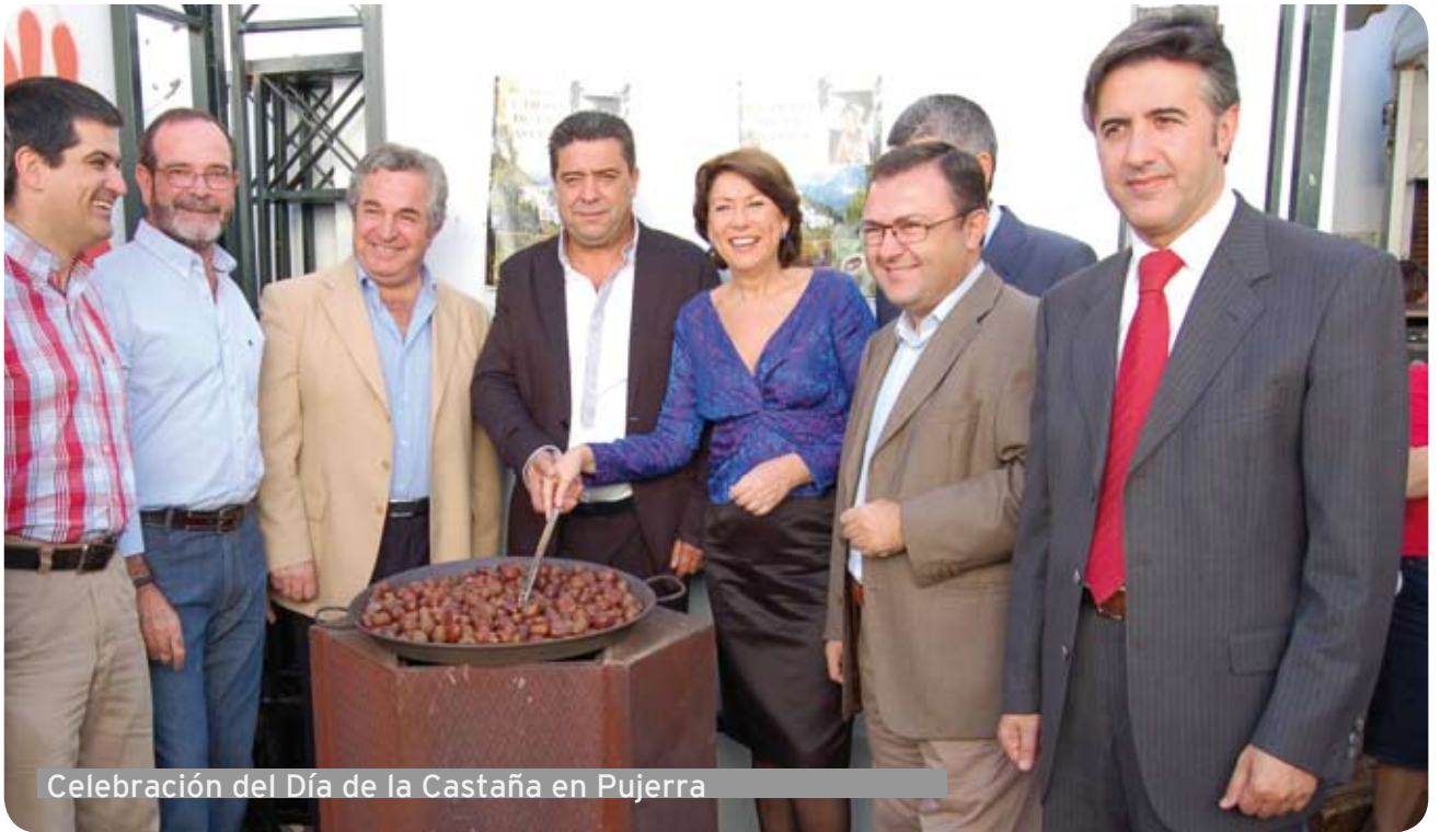
Celebración del Día de la Castaña en Pujerra