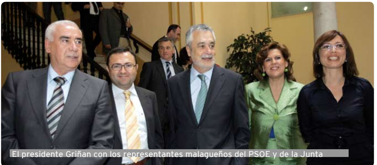
El presidente Griñan con los representantes malagueños del PSOE y de la Junta