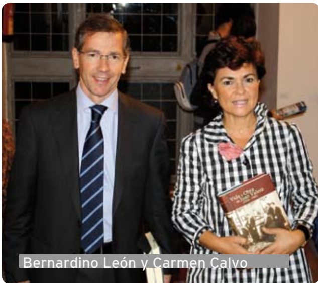
Bernardino León y Carmen Calvo