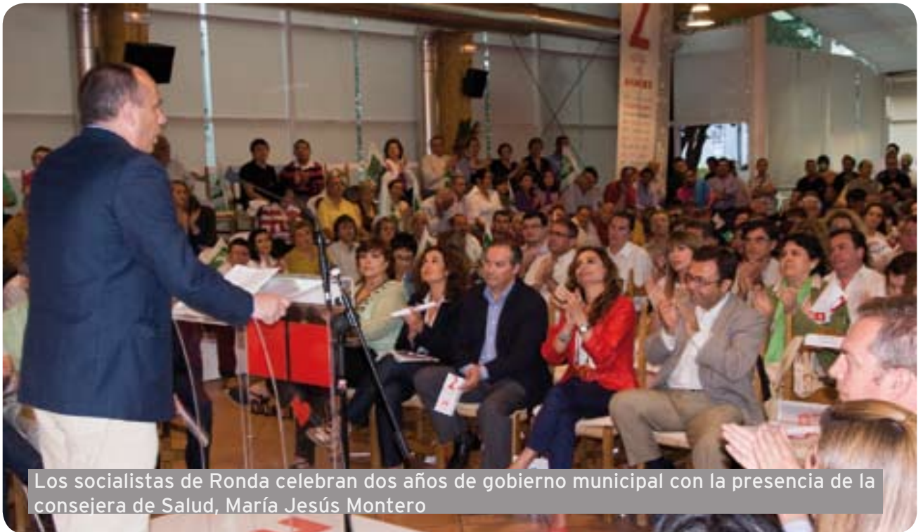
Los socialistas de Ronda celebran dos años de gobierno municipal con la presencia de la consejera de Salud, María Jesús Montero