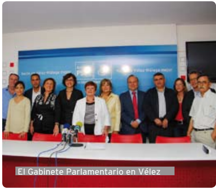
El Gabinete Parlamentario en Vélez