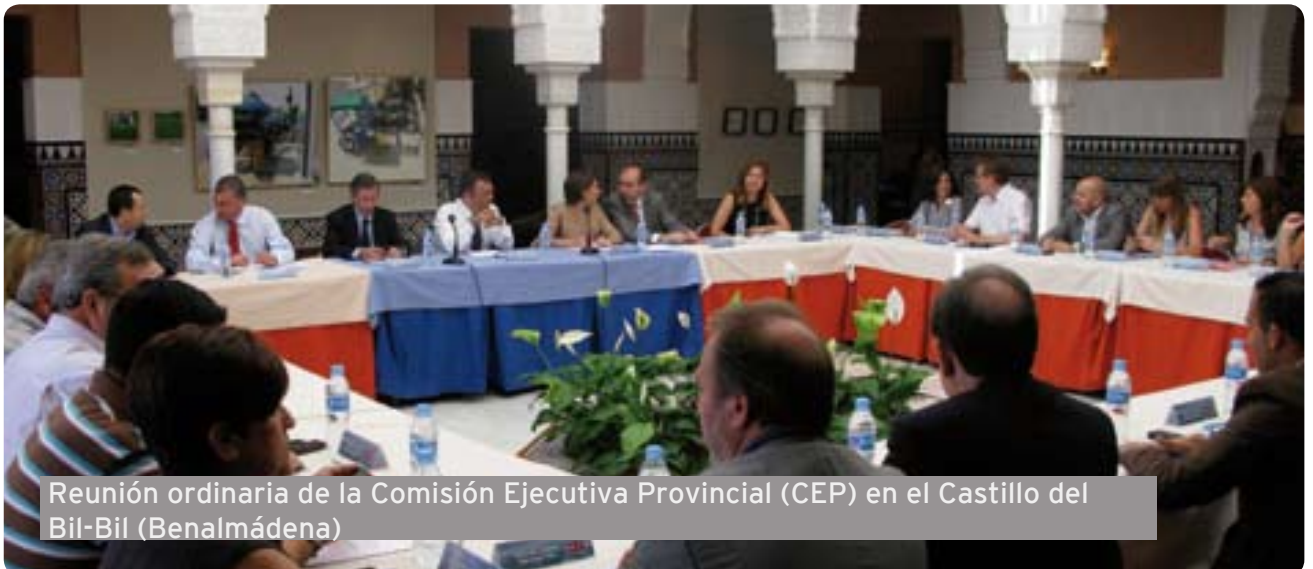
Reunión ordinaria de la Comisión Ejecutiva Provincial (CEP) en el Castillo del Bil-Bil (Benalmádena)